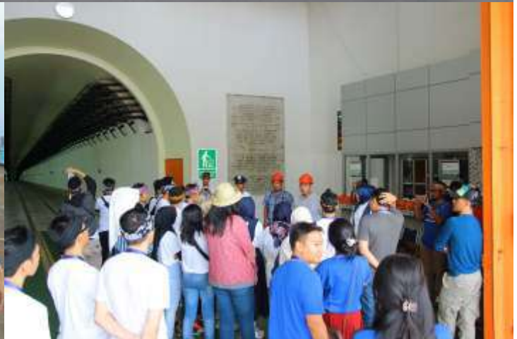
Perum Jasa Tirta II Gelar Community Gathering dalam rangka Menyambut HUT ke 50