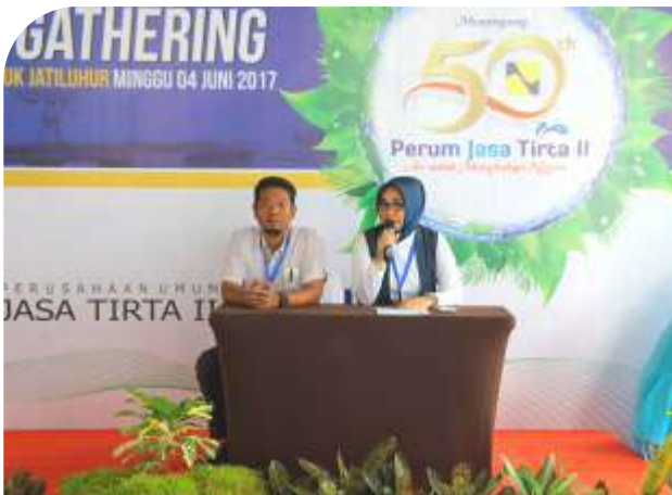
Perum Jasa Tirta II Holds The Community Gathering in order to Welcoming The 50th Anniversary