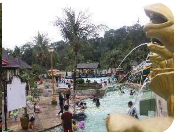
Wisatawan Padati Kawasan Wisata Grama Tirta Jatiluhur Saat Libur Lebaran 1438 H