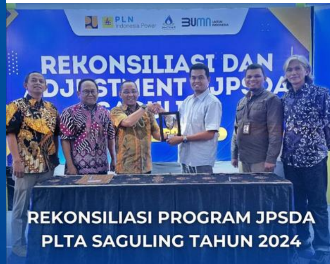
REKONSILIASI PROGRAM JPSDA PLTA SAGULING TAHUN 2024

Perum Jasa Tirta II bersama PLN Indonesia Power menggelar Rekonsiliasi dan Adjustment program JPPSDA PLTA Saguling Tahun 2024.