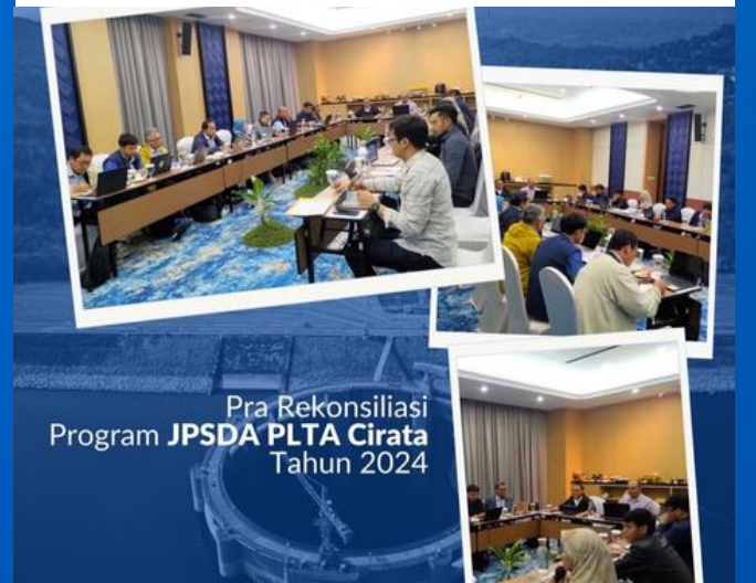
Pra Rekonsiliasi Program JPSDA PLTA Cirata Tahun 2024

Pra Rekonsiliasi Program JPSDA PLTA Cirata Tahun 2024.