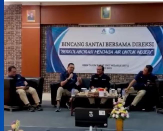
Bincang santai Serikat Karyawan Perum Jasa Tirta II bersama dengan Direksi di Kantor Unit Wilayah I, Bekasi.