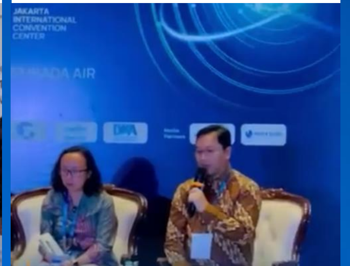
Perum Jasa Tirta II menjadi narasumber pada sesi "Transformasi air minum mendukung asta cita swasembada air".