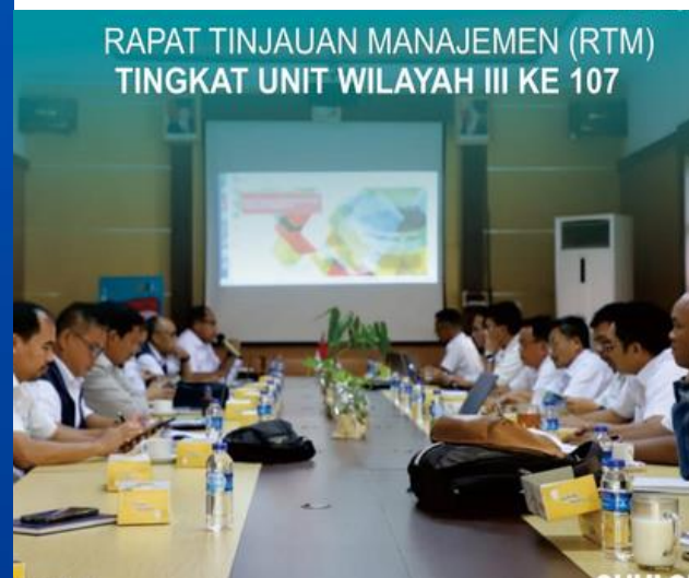
RAPAT TINJAUAN MANAJEMEN (RTM) TINGKAT UNIT WILAYAH III KE 107

Rapat Tinjauan Manajemen (RTM) Tingkat Unit Wilayah III ke-107.