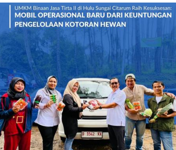
UMKM Binaan Jasa Tirta II di Hulu Sungai Citarum Raih Kesuksesan: MOBIL OPERASIONAL BARU DARI KEUNTUNGAN PENGELOLAAN KOTORAN HEWAN

UMKM Binaan Jasa Tirta II di Hulu Sungai Citarum raih kesuksesan: mobil operasional baru dari keuntungan pengelolaan kotoran hewan.