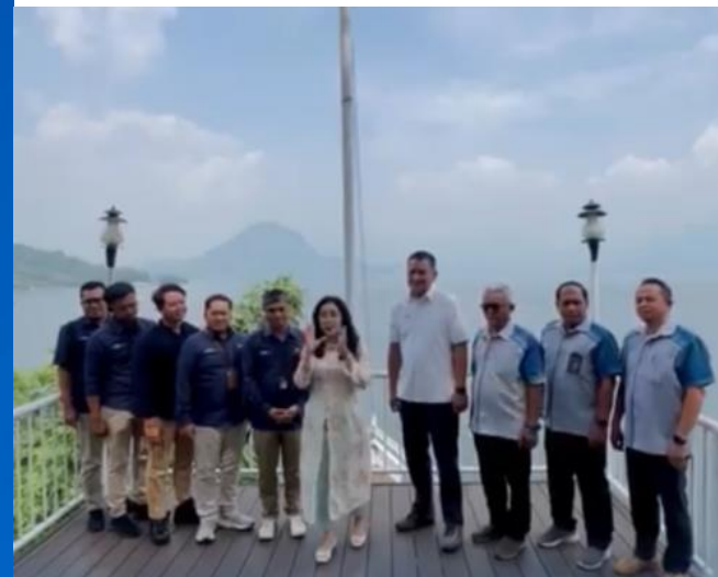
Perum Jasa Tirta II menerima kunjungan Anggota DPR RI Komisi VI yang akan berdialog langsung dengan warga Jatimekar, Jatiluhur.