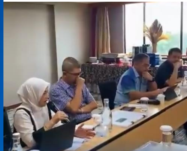
Perum Jasa Tirta II bersama PDAM Tirta Wening melaksanakan pembahasan perjanjian kerja sama.