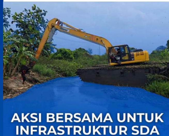
Perum Jasa Tirta II bersama Pemerintah Subang, BBWS Citarum melakukan penertiban bangunan liar di saluran pembuang pangaritan.