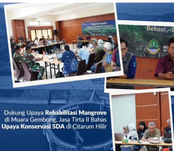
Dukung Upaya Rehabilitasi Mangrove di Muara Gembong, Jasa Tirta II Bahas Upaya Konservasi SDA di Citarum Hilir

Dukung upaya Rehabilitasi Mangrove di Muara Gembong, Jasa Tirta II bahas upaya konservasi SDA di Citarum Hilir.