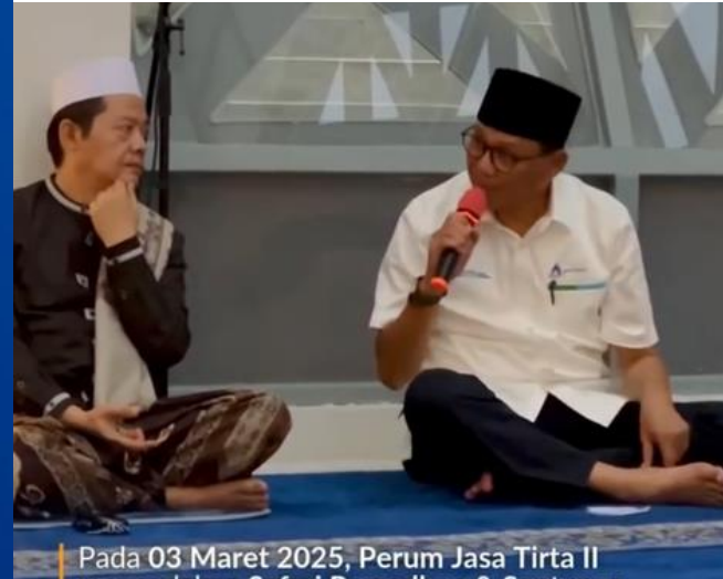
Pada 03 Maret 2025, Perum Jasa Tirta II

Perum Jasa Tirta mengadakan Safari Ramadhan dan santunan anak yatim di Kantor Pusat Perum Jasa Tirta II.