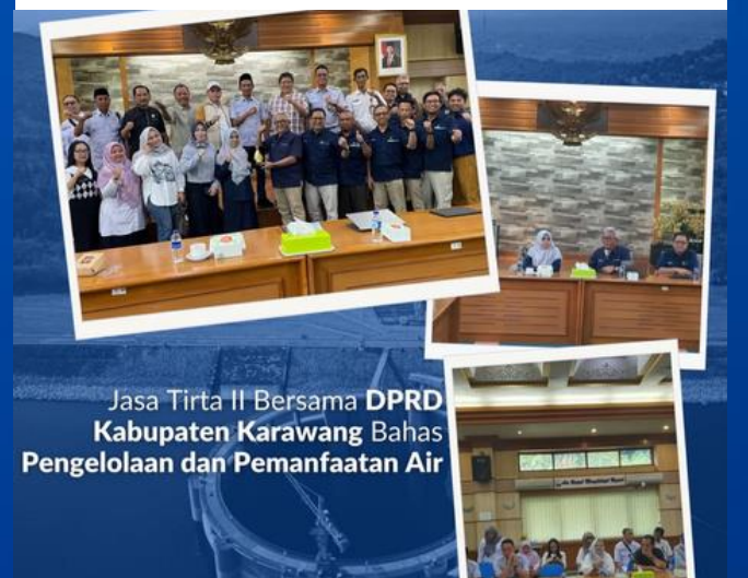
Jasa Tirta II Bersama DPRD Kabupaten Karawang Bahas Pengelolaan dan Pemanfaatan Air

Jasa Tirta II bersama DPRD Karawang bahas pengelolaan dan pemanfaatan air.