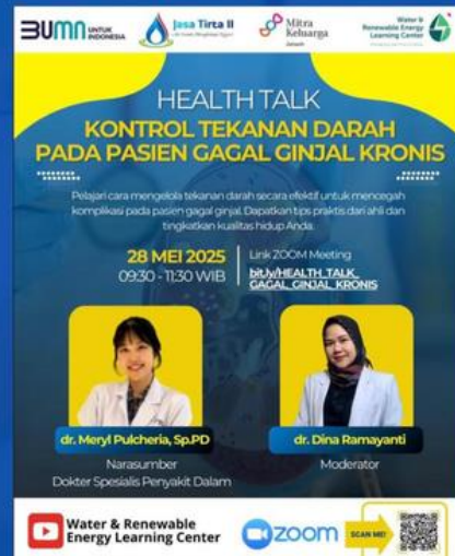
Health Talk - Kontrol Tekanan Darah Pada Pasien Gagal Ginjal Kronis.