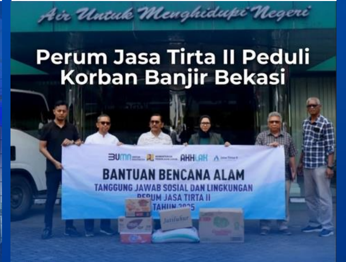
Perum Jasa Tirta II Peduli Korban Banjir Bekasi

Tim TJSL Perum Jasa Tirta II menyalurkan bantuan bagi warga terdampak banjir di Kota Bekasi.