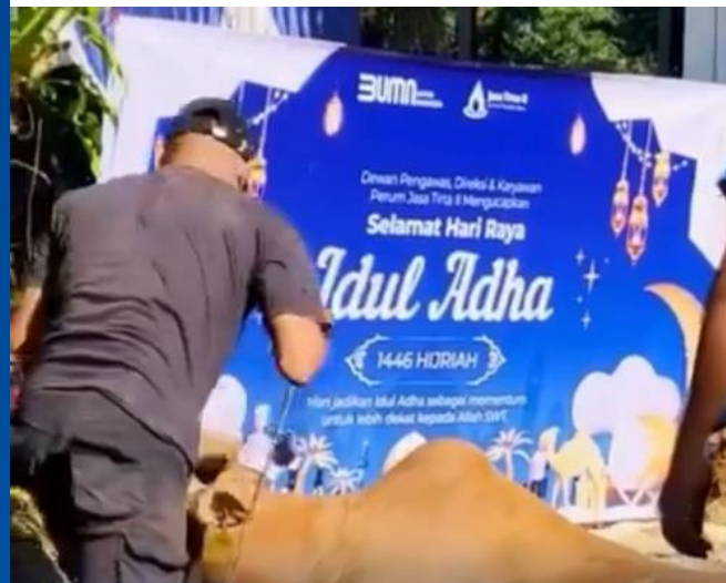
Dalam rangka Idul Adha 1446H, Perum Jasa Tirta II melaksanakan pemotongan hewan kurban sebanyak 7 ekor sapi dan 14 ekor kambing.