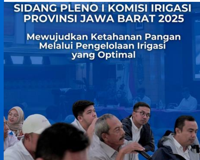
SIDANG PLENO I KOMISI IRIGASI PROVINSI JAWA BARAT 2025

Mewujudkan Ketahanan Pangan Melalui Pengelolaan Irigasi yang Optimal