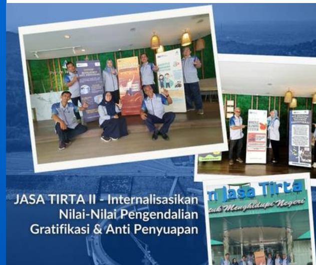
JASA TIRTA II - Internalisasikan Nilai-Nilai Pengendalian Gratifikasi & Anti Penyyuapan

Perkuat komitmen SMAP, Jasa Tirta II Internalisasikan nilai-nilai anti penyyuapan.