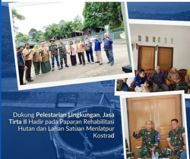
Dukung Pelestarian Lingkungan, Jasa Tirta II Hadir pada Paparan Rehabilitasi Hutan dan Lahan Satuan Menlatpur Kostrad

Dukung Pelestarian Lingkungan, Jasa Tirta II hadir pada Paparan Rehabilitasi Hutan dan Lahan Satuan Menlatpur Kostrad.