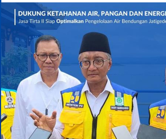
DUKUNG KETAHANAN AIR, PANGAN DAN ENERGI Jasa Tirta II Siap Optimalkan Pengelolaan Air Bendungan Jatigede

Dukung ketahanan air, pangan dan energi Jasa Tirta II siap optimalkan pengelolaan air Bendungan Jatigede.