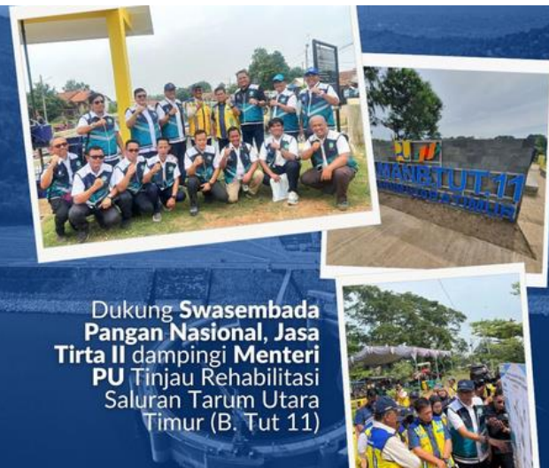
Dukung Swasembada Pangan Nasional, Jasa Tirta II dampingi Menteri PU Tinjau Rehabilitasi Saluran Tarum Utara Timur (B. Tut 11)

Dukung Swasembada Pangan Nasional, Jasa Tirta II dampingi Menteri PU Tinjau Rehabilitasi Saluran Tarum Utara Timur (B. Tut 11).