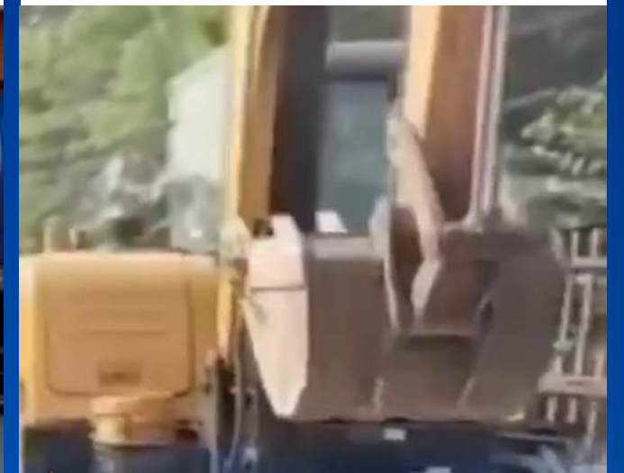
Perum Jasa Tirta II melakukan kegiatan pembongkaran bangunan liar di sekitar BTb 36A, Desa Sukadanau, Cikarang.