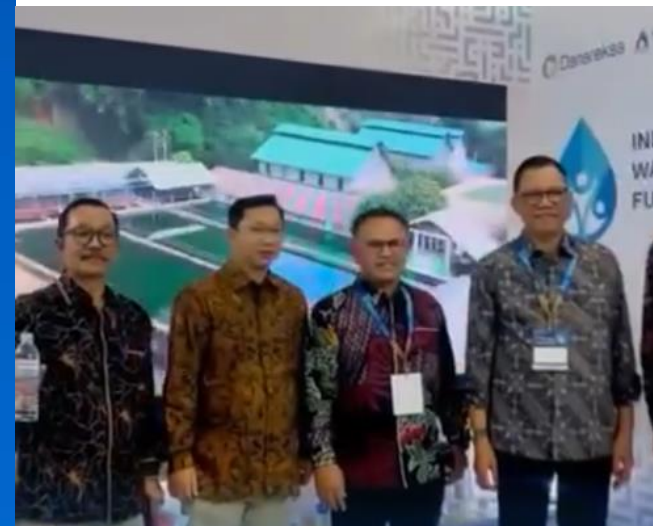
Perum Jasa Tirta II turut andil dalam Indonesia Water and Wastewater Expo and Forum (IWWEF).