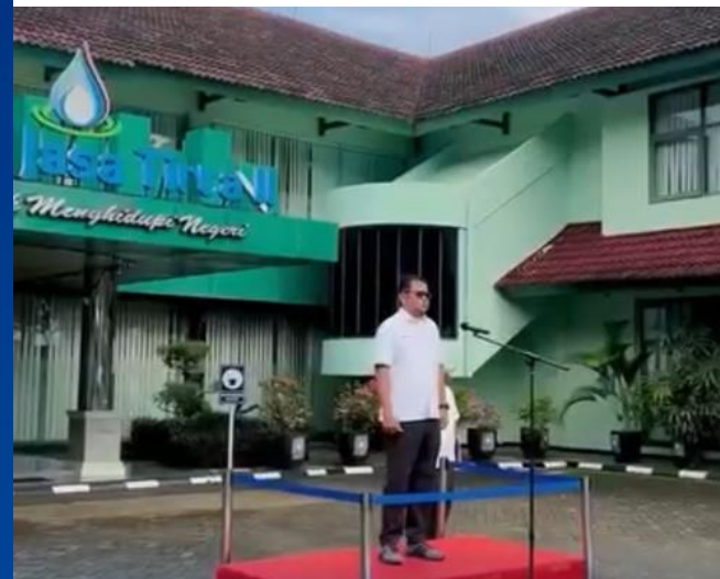
Perum Jasa Tirta II melaksanakan Upacara Peringatan Hari Lahir Pancasila di Kantor Pusat.