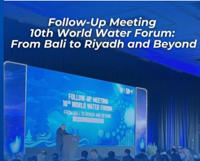
Follow-Up Meeting 10th World Water Forum: From Bali to Riyadh and Beyond

Follow-Up meeting 10th WWF telah sukses digelar, Jasa Tirta II sebagai bagian dari NARBO berperan aktif dalam Integrated Water Resource Management .