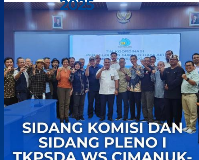
SIDANG KOMISI DAN SIDANG PLENO I TKPSDA WS CIMANUK-

Sidang Komisi dan Sidang Pleno I Tim Koordinasi Pengelolaan Sumber Daya Air (TKPSDA).