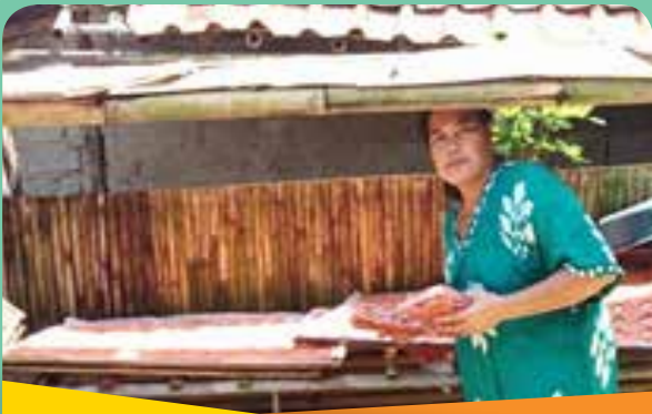
Jumeno (Industri Rengginang "Jumeno")