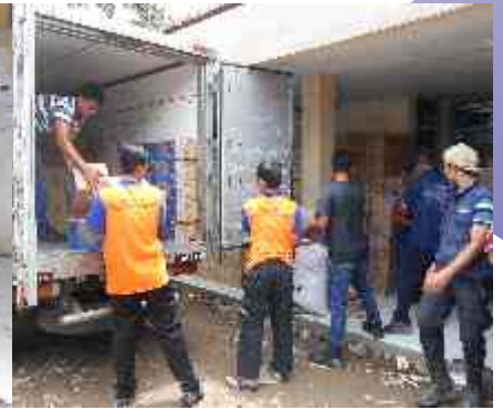
Flood's Aid for Flood's Victims in Bandung Regency

Friday, March 18, 2016, Perum Jasa Tirta II given the second flood's aid to flood victims in Bandung Regency through the Agency of Regional Disaster Management (BPBD) Bandung Regency. PJT II had given away 200 boxes of bottled drinking water, 50 boxes of instant noodles, 100 pieces of towels, 240 packets of biscuits, 3 sacks of clothing, medicines and cash money.