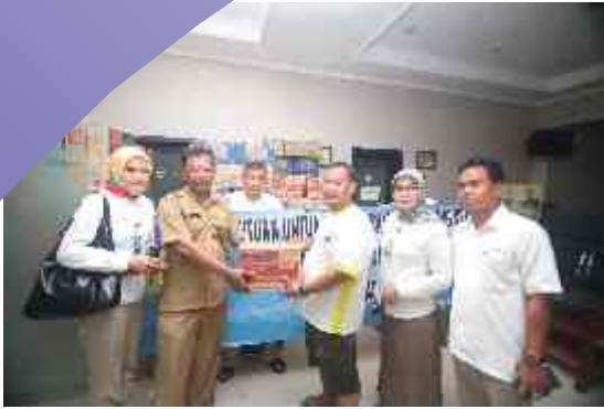
Bantuan Untuk Korban Banjir Wilayah Kab. Bandung

Perum Jasa Tirta II melalui Divisi Pengelolaan Air IV menyerahkan bantuan kepada korban banjir di wilayah Kec. Dayeuh Kolot Kabupaten Bandung pada tanggal 14 Maret 2016 dan 18 Maret 2016 berupa 350 dus AMKD Jatiluhur Demineral dan 100 dus mie instan, 100 buah handuk, 240 bungkus biskuit, 3 karung pakaian layak pakai, obat2an dan uang tunai.