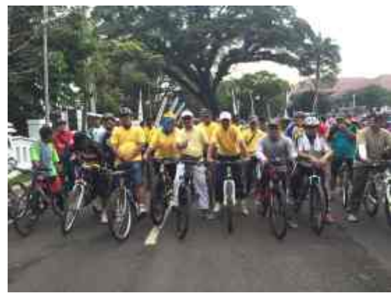
The Anniversary of Subang Regency