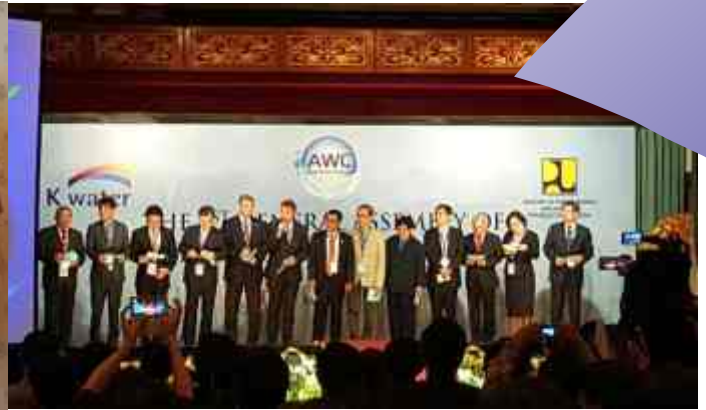
The 1st General Assembly for Asia Water Council

T he first Meeting of the Asia Water Council (AWC) or The 1st General Assembly for Asia Water Council was opened by the Director General of Water Resources (SDA), Mudjadi representing the Minister of Public Works and Public Housing (PUPR) Basuki Hadimuljono in Nusa Dua, Bali on Thursday, 24 March 2016.