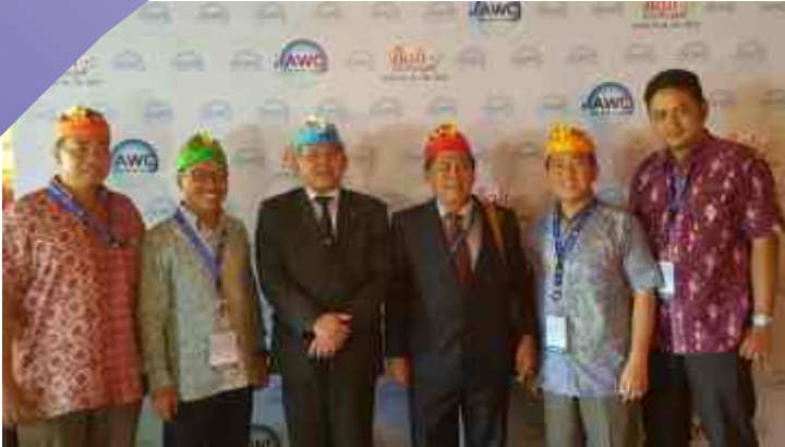
PJT II Hadir dalam 1st General Assembly for Asia Water Council

P ertemuan Pertama Asia Water Council (AWC) atau The 1st General Assembly for Asia Water Council dibuka oleh Dirjen Sumber Daya Air (SDA), Mudjadi mewakili Menteri Pekerjaan Umum dan Perumahan Rakyat (PUPR) Basuki Hadimuljono di Nusa Dua, Bali pada hari Kamis, 24 Maret 2016.