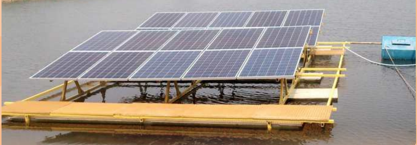
Peluncuran Pembangkit Listrik Tenaga Surya (PLTS) Floating PV di SPAM Curug